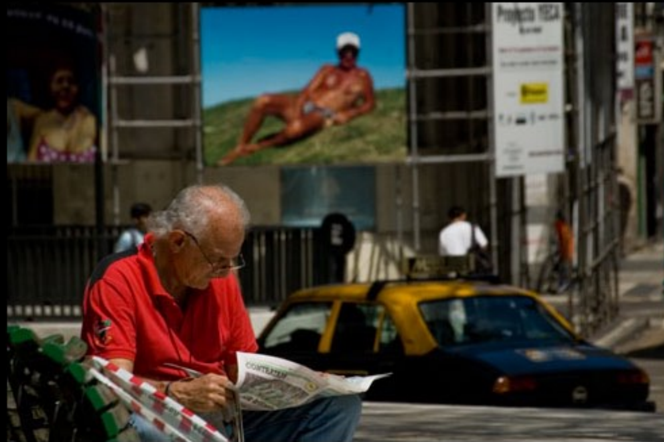
BUENOS AIRES IN TECHNICHOLOR

http://www.roberdam.com/roberdam/blog/?p=416