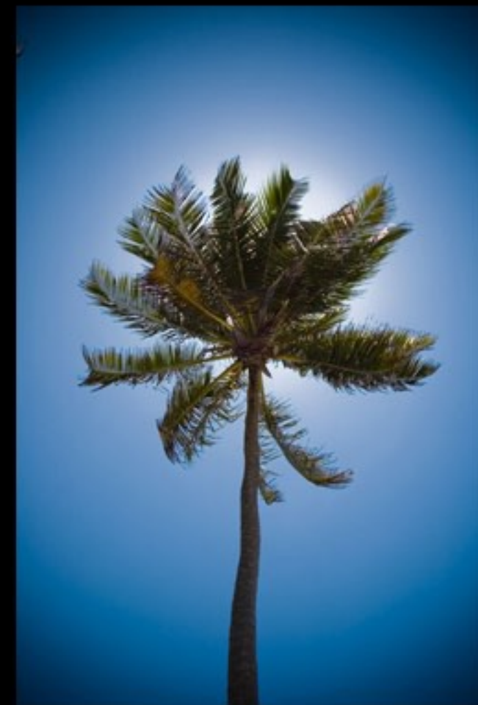
COSTA DO SAUIPE

http://www.roberdam.com/roberdam/blog/?p=423