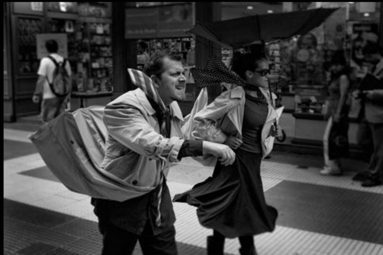
BS AS IN BW

http://www.roberdam.com/roberdam/blog/?p=411